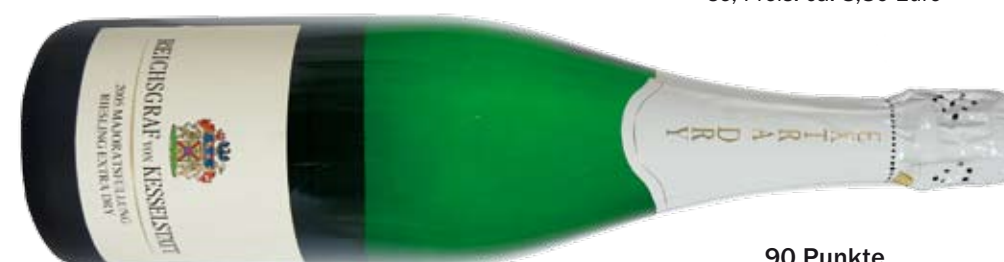
90 Punkte 2005 Majoratsfüllung Riesling brut extra dry, Reichsgraf von Kesselstatt; frische Eleganz, etwas süßlich, feine Frucht; Preis: ca. 10,90 Euro