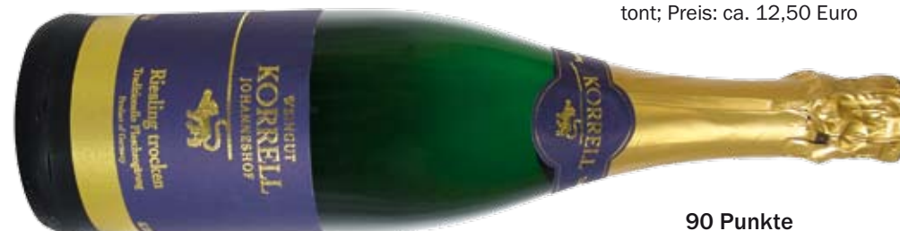
90 Punkte Winzersekt Riesling trocken, Weingut Korrell; erfrischend, Holunder, Aprikose; Preis: ca. 8,80 Euro