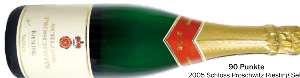
90 Punkte 2005 Schloss Proschwitz Riesling Sekt b.A. brut, Weingut Schloss Proschwitz Prinz zur Lippe; gute Balance, Kiwi, stoffig, etwas robust; Preis ca. 16 Euro