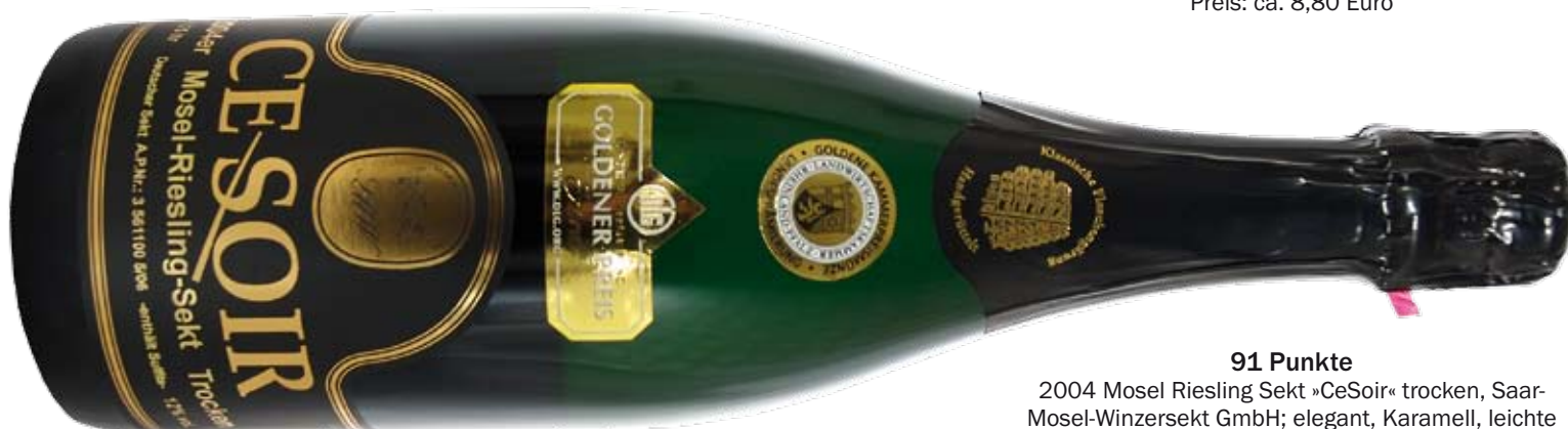
91 Punkte 2004 Mosel Riesling Sekt »CeSoir« trocken, Saar-Mosel-Winzersekt GmbH; elegant, Karamell, leichte Süße, ausgewogen; Preis: ca. 10,50 Euro