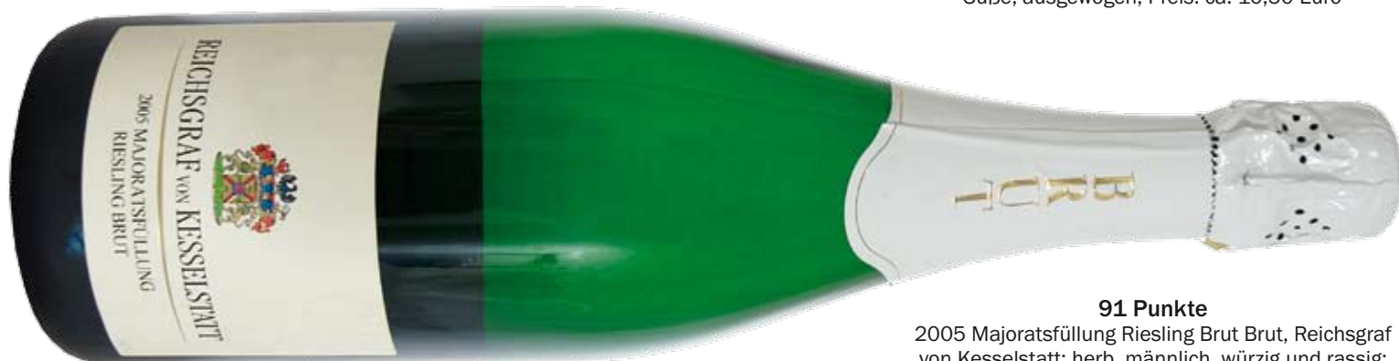
91 Punkte 2005 Majoratsfüllung Riesling Brut Brut, Reichsgraf von Kesselstatt; herb, männlich, würzig und rassig; Preis: ca. 12,30 Euro