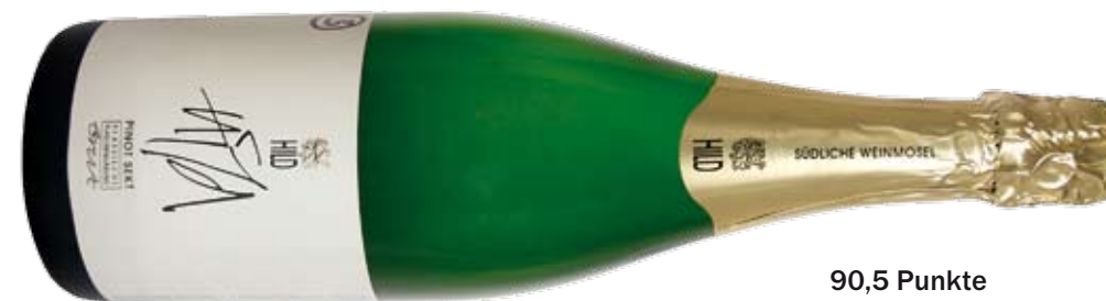
90,5 Punkte Pinot Sekt brut von Johann Hild; seidig, Holz-Touch, karamellige Eleganz, feine Frucht; Preis: ca. 9,80 Euro