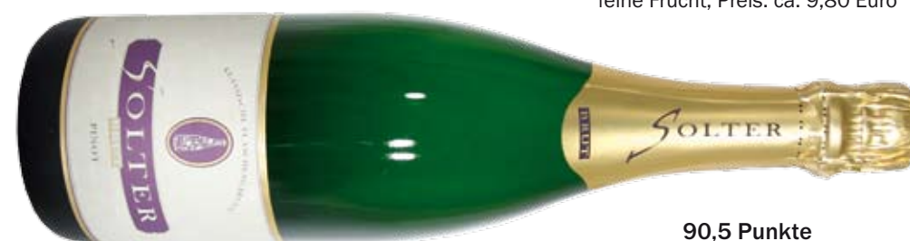
90,5 Punkte 2002 Solter Brut Pinot, Sekt- und Weinhaus Solter; dichte Aromatik, Power, direkte Ansprache, säurebetont; Preis: ca. 12,50 Euro