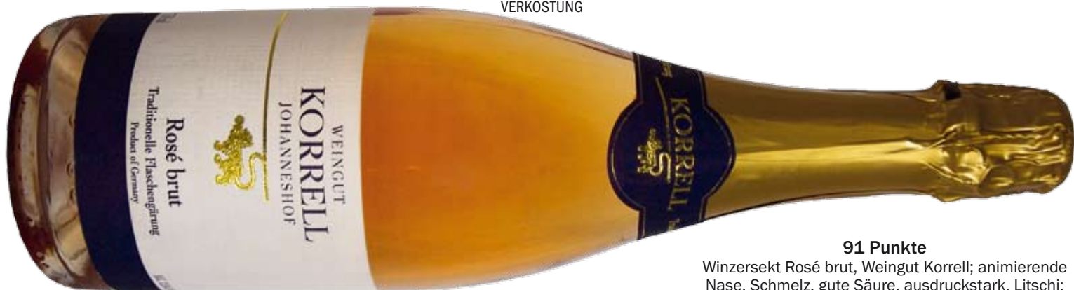
91 Punkte Winzersekt Rosé brut, Weingut Korrell; animierende Nase, Schmelz, gute Säure, ausdruckstark, Litschi; Preis: ca. 8,80 Euro