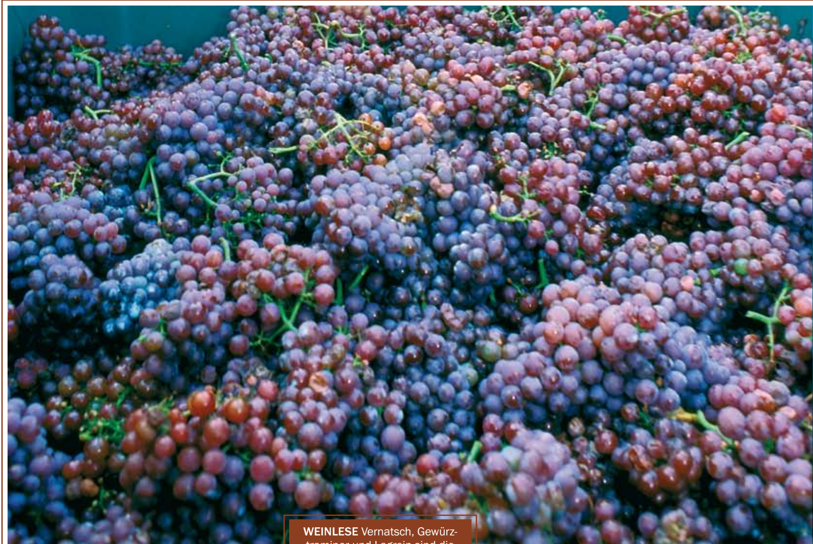
WEINLESE Vernatsch, Gewürztraminer und Lagrein sind die Ursprungsrebsorten in Südtirol